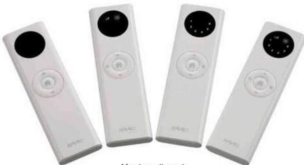
Mandos a distancia